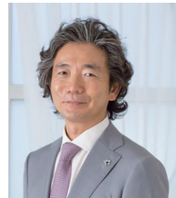
セミナー講師のご紹介

今回、ご紹介するBIOLASE社のWaterLase iPlusは他社では使用できない特殊な波長(2,780nm)を保有しており、処置内容に適した種々なチップ先端の形状を選択し、優れたパワーと波長に加えて噴き出す水スプレーの相乗効果でストレス無く目的に合った臨床上的使用感を得ることが可能です。是非、この機会に他のレーザーとは一味違うウォーターレーズの素晴らしさを実感して頂けたら幸いです。