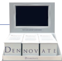
モニター付きディスプレイ