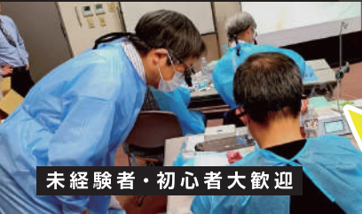
未経験者・初心者大歓迎