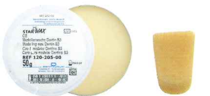
スターワックス デンチンB3 120-205-00