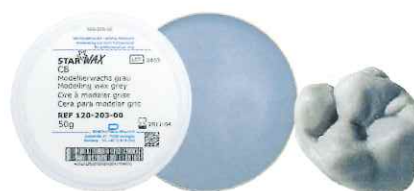
スターワックスCB グレー 120-203-00