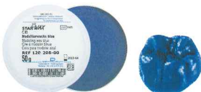
スターワックスCB ブルー 120-208-00

※写真はイメージです。 実際の商品と色調が異なる場合があります。 ※グレーには酸化チタンが含まれております。 オールセラミック等にご使用する場合はご注意ください。 届出番号27B1X00020219005