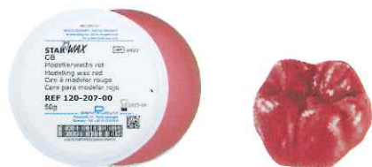
スターワックスCB レッド 120-207-00