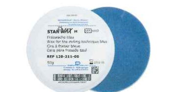
スターワックス ミリング(青) 120-211-00