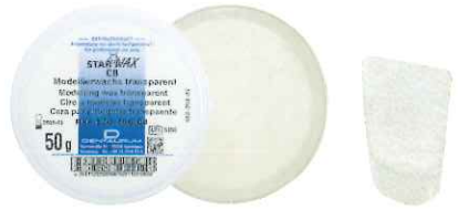
スターワックス トランスパレント 120-206-00

※写真はイメージです。実際の商品と色調が異なる場合があります。 届出番号27B1X00020219005