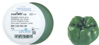
スターワックスCB グリーン 120-201-00