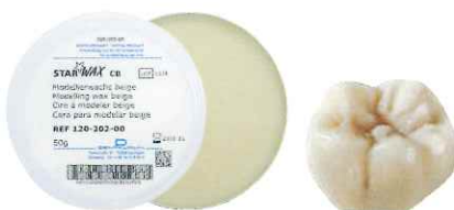
スターワックスCB ベージュ 120-202-00