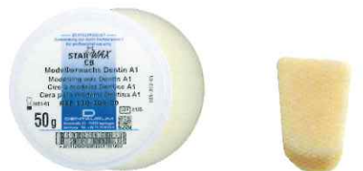
スターワックス デンチンA1 120-204-00