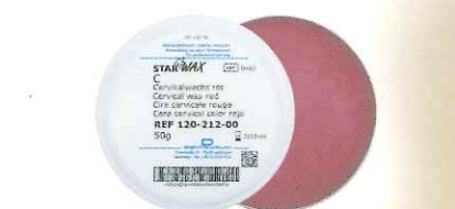
スターワックス サービカル(赤) 120-212-00