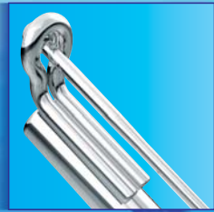
Omega loop ボールクラスプ(1.0mm)を通して使用 レーザー溶接されています