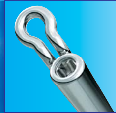
Inner hexagonal screw テレスコープの長さを変えて矯正力を調節