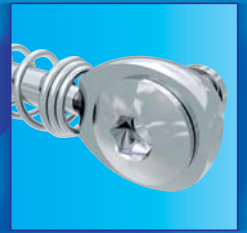
Outer hexagonal screw SUS 2 スクリューキーを用い 口腔内にて容易な装着 (ワイヤーにセット)