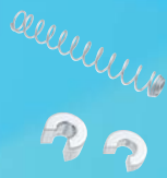
SUS 2 ターボスプリング(22mm) Activation with the SUS 2 turbo-spring 二次的にアクチベートさせたい場合、テレスコープエレメントにセットします