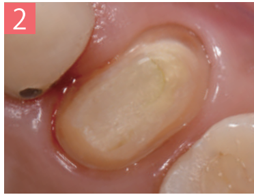
2. 支台歯形成後の状態を確認する。