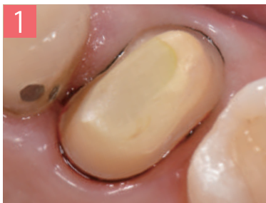
1. 支台歯形成後、絹糸で一次圧排をした上からペーストを注入する。