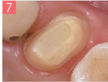
7. エアーで乾燥させる。