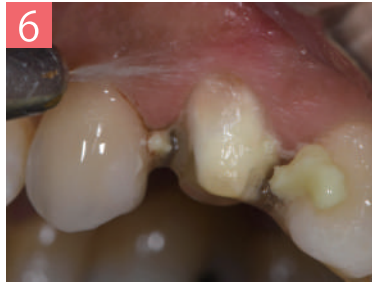
6. ペーストを水洗して除去する。