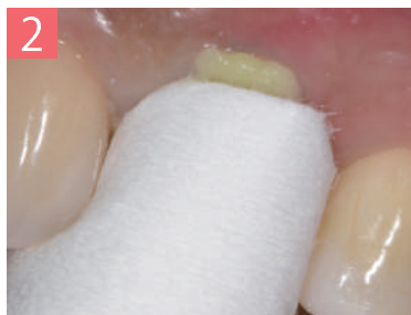
2. 圧排キャップ(別売:3種から選択)を使用して2分間噛んだ状態を保持する。