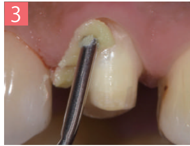
3. 支台歯の軸平面と平行になるようにアプリケーターを歯肉溝に挿入する。