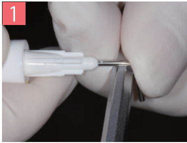
1. アプリケーター先端を曲げて調整する。