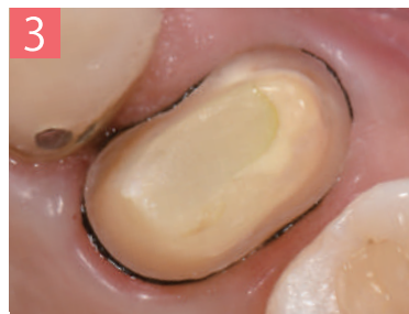
3. ペーストを水洗して除去し、エアード乾燥させる。