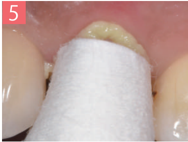
5. 圧排キャップ(別売:3種から選択)を使用して2分間噛んだ状態を保持する。